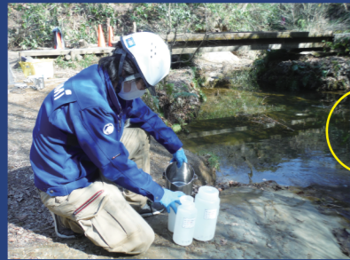
本社付近の川にて採水