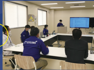
調査報告書の作成と発表