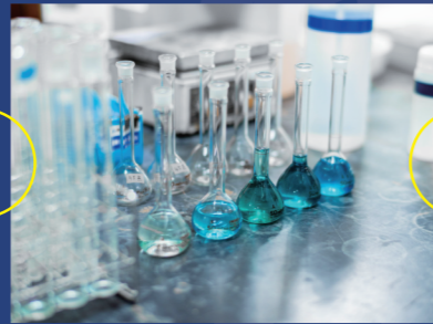
社内のラボにて水質分析